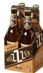
Karton à 4 Flaschen