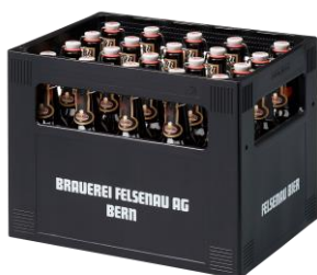
Harasse à 20 Flaschen